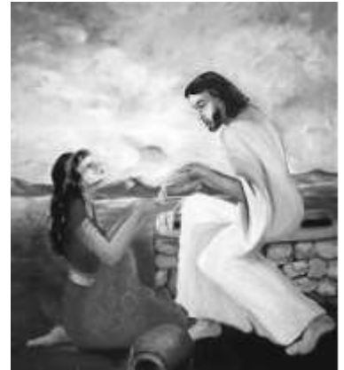
Jesus und die Samariterin am Brunnen

Der Ökumenische Kinder- und Jugendarbeitskreis Neubrandenburg