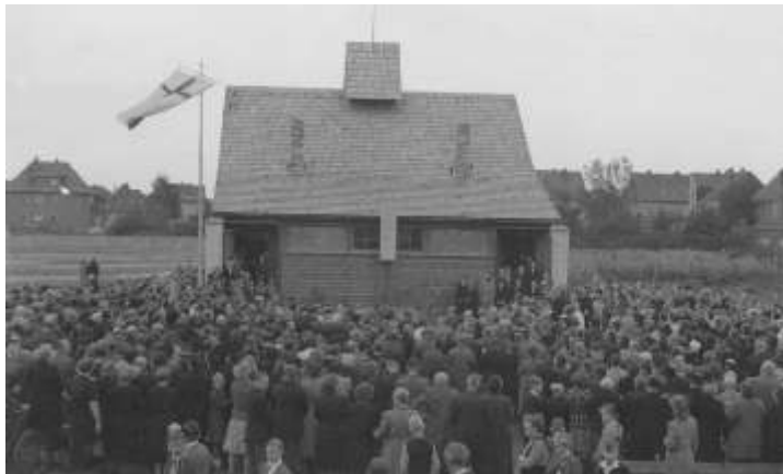
Kirchweihfest am 16. September 1951

A m 16. September 1951 eingeweiht, feiern wir am 18. September um 10 Uhr unseren festlichen Geburtstagsgottesdienst anlässlich des 60. Geburtstages unserer Kapelle.