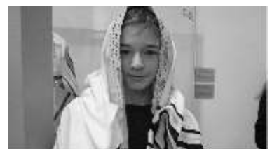
Besuch im jüdischen Museum mit der Möglichkeit zwischen verschiedenen thematischen Führungen zu wählen