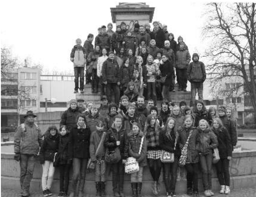
Die Konfis aus unserer Propstei

Im März waren wir mit ca. 70 Jugendlichen, Vor- und Hauptkonfirmanden/innen aus unserer Propstei und Umgebung in Berlin. Unser Wochenende stand unter dem Thema „Weltreligionen erleben“. Wir besuchten das Jüdische Museum, wurden von 2 Muslimen durch eine Berliner Moschee geführt, lernten den Buddhismus in einem Zentrum kennen. Sonntag waren wir zum Gottesdienst in der Freien Evangelischen Lukaskirche. Woanders hinzuschauen hilft manchmal die Frage zu beantworten: warum bin ich eigentlich Christ?