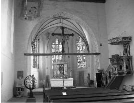
Foto: Ehemalige Klosterkirche Verchen