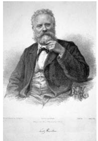
Fritz Reuter, geb. am 7. November 1810 in Stavenhagen; gest. am 12. Juli 1874 in Eisenach;