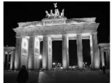
Aus Neubrandenburg, der Stadt der Vier Tore, geht es in Berlin nicht ohne das Brandenburger Tor, immer ein Erlebnis.

Im März waren wir mit ca. 70 Jugendlichen, Vor- und Hauptkonfirmanden/innen aus unserer Propstei und Umgebung in Berlin. Unser Wochenende stand unter dem Thema „Weltreligionen erleben“. Wir besuchten das Jüdische Museum, wurden von 2 Muslimen durch eine Berliner Moschee geführt, lernten den Buddhismus in einem Zentrum kennen. Sonntag waren wir zum Gottesdienst in der Freien Evangelischen Lukaskirche. Woanders hinzuschauen hilft manchmal die Frage zu beantworten: warum bin ich eigentlich Christ?