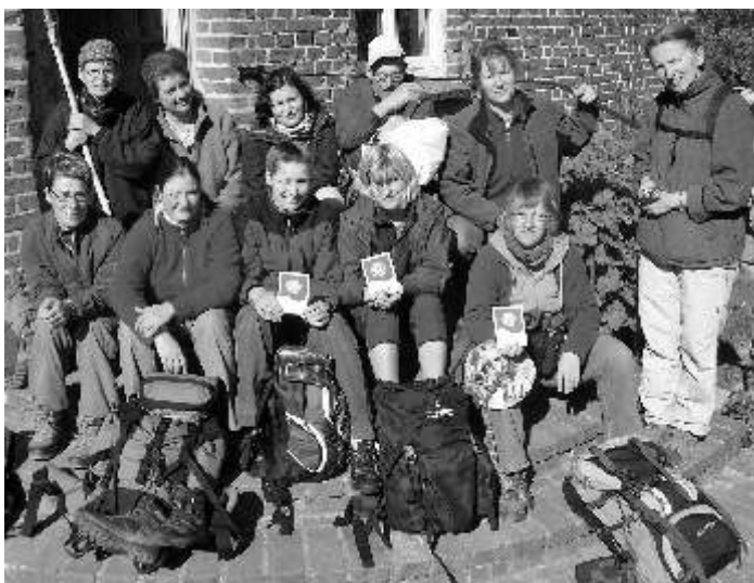
Unsere Pilgergruppe in Ballwitz

Nach Ostern war eine zwölköpfige Pilgergruppe unterwegs auf dem neuen Pilgerweg Mecklenburgische Seenplatte. Diese Pilgerreise war als pädagogische Weiterbildung ausgeschrieben worden: „Anleitung zu spirituellem und ganzheitlichem Leben“.