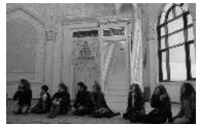
Während des Besuchs in der Moschee