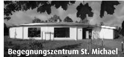
Begegnungszentrum St. Michael